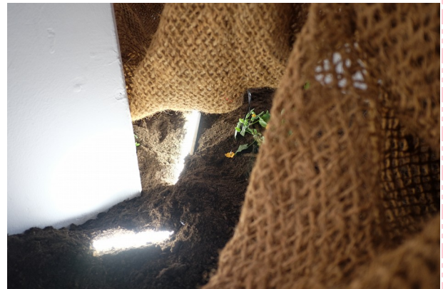
Iteratien #4: tentoonstelling in esc, 2019