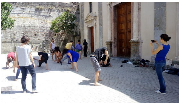
Iteraties #2: Transformatorio, 2018