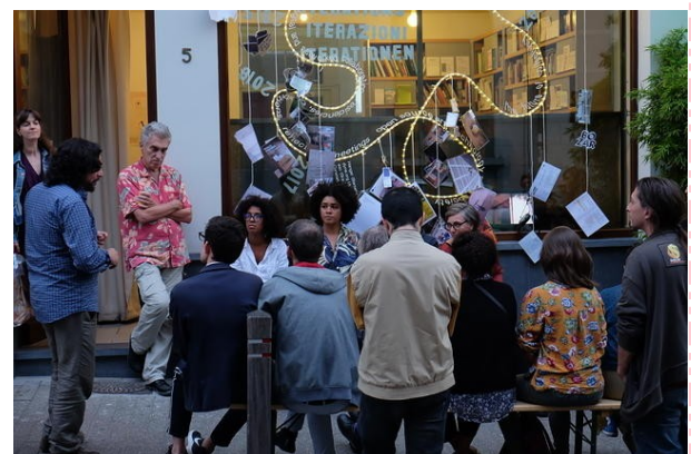
Constant_V, installatie in Brussel, 2018