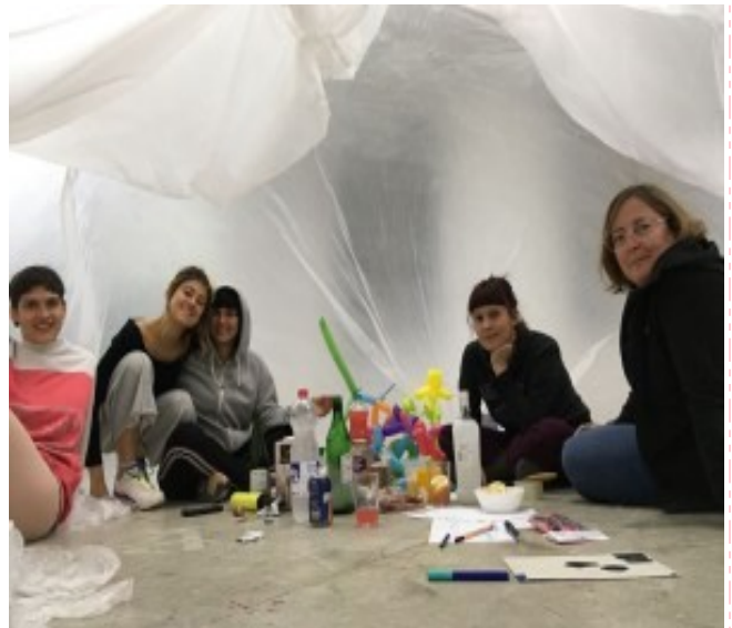
Iteraties #3: residentie in Hangar, 2018