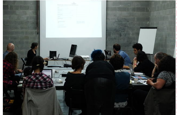
Iteraties #1 : seminar in Hangar, 2017