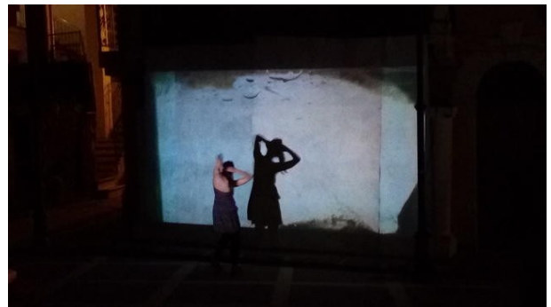
Iteraties #2: Transformatorio, 2018