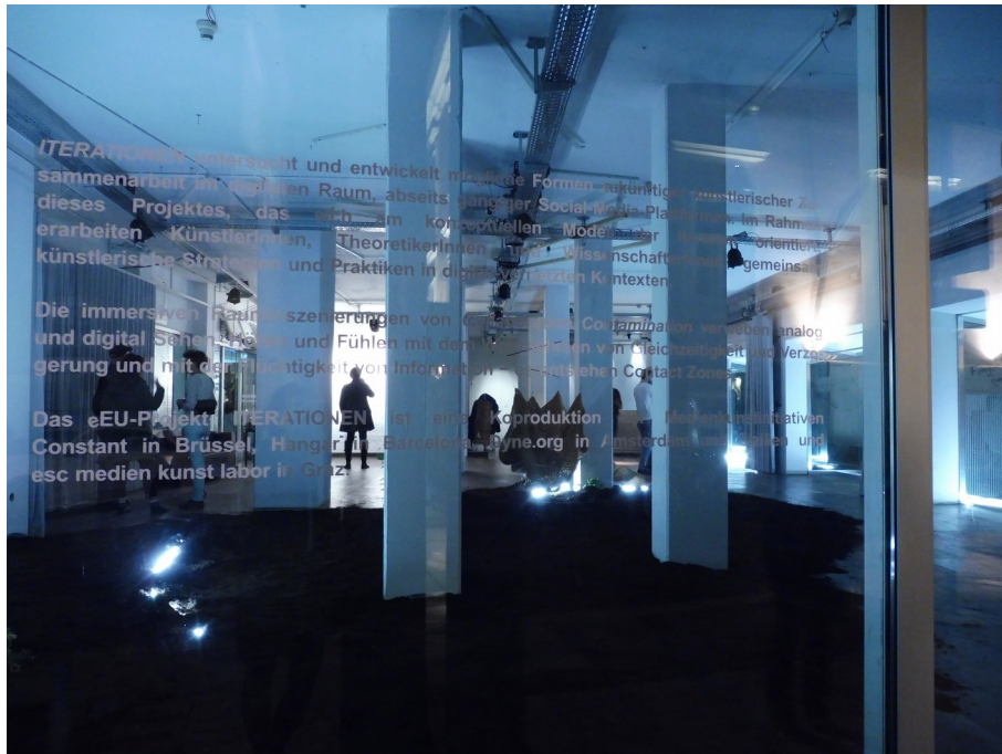
Iteratien #4: tentoonstelling in esc, 2019