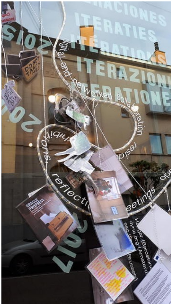
Constant_V, installatie in Brussel, 2018